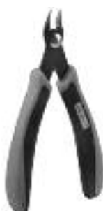
Art. Nr. 170688 SPEZIAL-SEITENSCHNEIDER

Vloeibare lijm in plastic-flescon met doseerbuisje om nauwkeurig te lijmen.